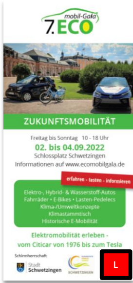
Flyer DIN Lang Auflage: 10.000 Verteilung und Versand