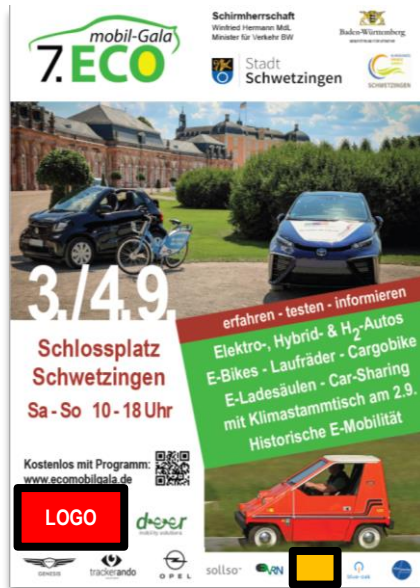
Plakate DIN A1 Auflage: 500 Plakate DIN A3 Auflage: 400 Verteilung und Versand, Aufhängen an offiziellen Werbe-Stellen, Ticketshops etc. in der Region