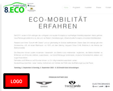
Website-Werbung Startseite www.ecomobilgala.de