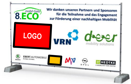
Sponsorenwand 2x3,5m Platzierung an beiden Zugängen des Events